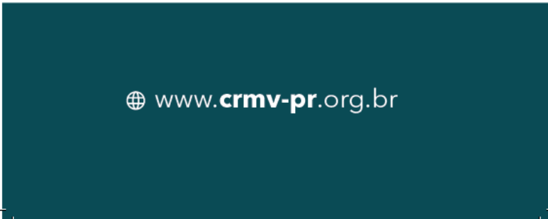
4) Arte a ser impressa na Janela 2