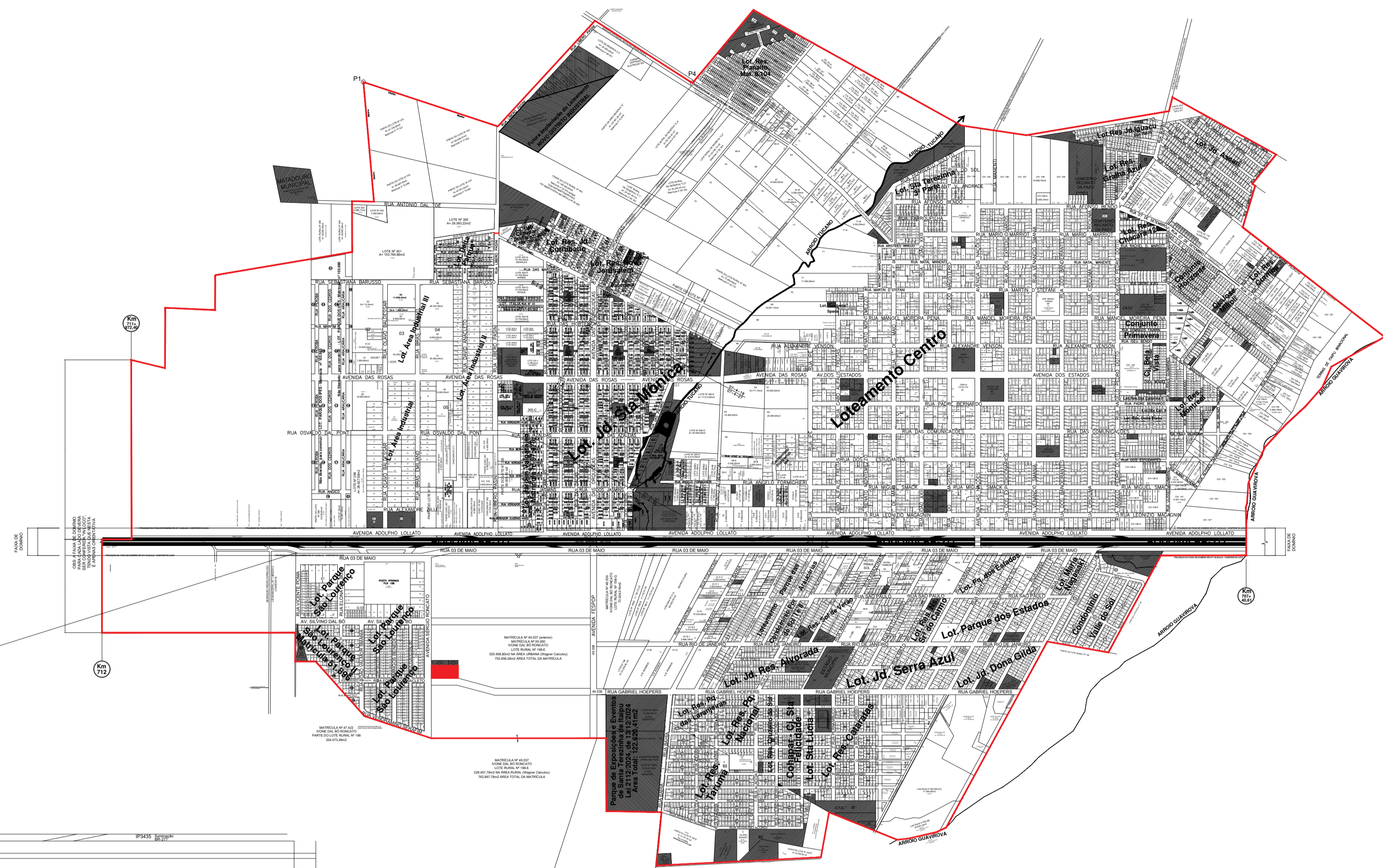
PLANTA DE LOCALIZAÇÃO ESCALA 1:750

PROLONGAMENTO RUA EDMUNDO ANACLETO (CONVÊNIO EM ANDAMENTO)