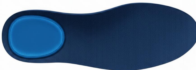
Figura 2 – Vista Superior – Palmilha de Conforto e Higiênização