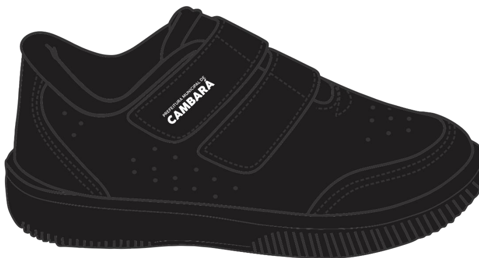
Figura 1 – Vista Lateral – Tênis Fechamento por Velcro

O calçado deve ser composto por duas partes principais (CABEDAL e SOLADO), subdivididas conforme descrito a seguir, com suas respectivas características técnicas.