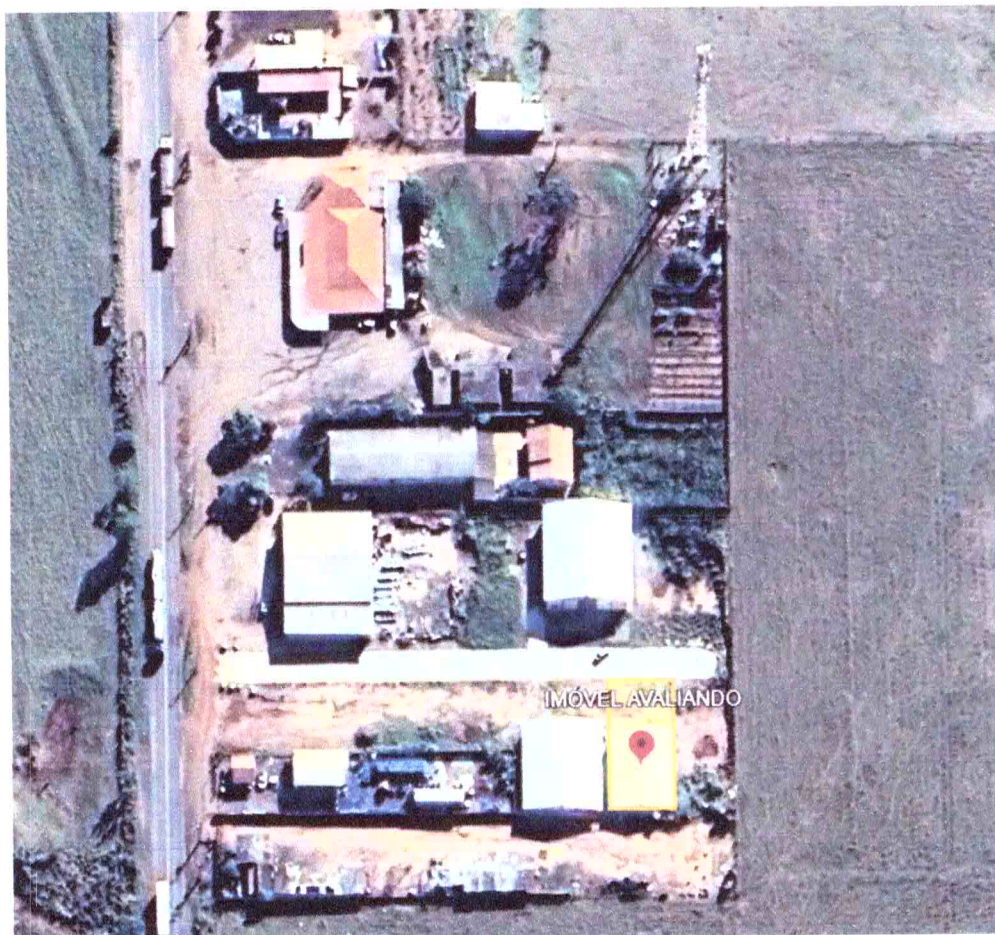
Imagem 01 – Localização do imóvel avaliando