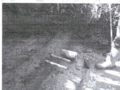
Figura 17 - Assentamento dos canos de abastecimento

A barragem deve ser erguida ainda alguns centímetros acima do cano ladrão, para então ser finalizada.