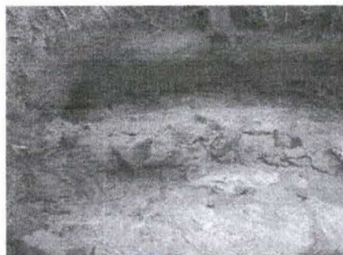
Figura 15 - Aspecto da barragem, observando-se as pedras unidas pela massa de solo-cimento

Avenida Tapejara, 88 – Centro - CEP 87.780-000 - Fone: (044) 3431 8000 Paraíso do Norte – Estado do Paraná - CNPJ: 75.476.556/0001-58 www.paraisodonorte.atende.net - e-mail: engenharia@paraisodonorte.pr.gov.br urbanismo@paraisodonorte.pr.gov.br