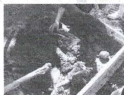
Figura 10 - Massa após a adição de água