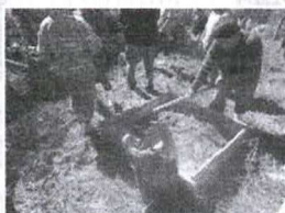
Figura 9 - Mistura de terra com cimento

melhor será o resultado final. É realizada, então, a mistura da terra ao cimento, mexendo bem, ainda a seco. É importante destacar que o cimento recomendado para esse trabalho é o cimento estrutural, de secagem rápida. Os resultados obtidos com esse cimento são muito superiores ao do cimento comum. A proporção, como dito anteriormente, irá variar entre 3:1 e 4:1 (terra : cimento), dependendo da textura do solo, ou seja, quanto mais arenoso, maior a necessidade de cimento. Quando a mistura estiver homogênea, deve-se amontoá-la, abrindo uma pequena cova no centro do monte. Nesta cova, inicia-se a adição de água, aos poucos, revolvendo bem a mistura, até se atingir o ponto desejado, que é aquele no qual massa fica no ponto plástico adequado para ser moldada, ou seja, fica firme, porém permite a compressão ao toque dos dedos, conforme pode ser observado nas Figuras 10 e 11. Para o melhor manuseio da massa, recomenda-se que seja separada em pequenas bolas (Figura 12). Não se deve preparar grandes quantidades da massa, uma vez que a sua secagem é muito rápida. Recomenda-se, ainda, que a mistura seja realizada em uma masseira pois, quando é feita diretamente sobre o solo, há perda significativa de material.