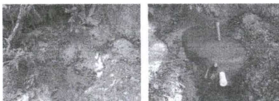
Figuras 35 e 36 - Trabalho de proteção de nascente realizado na propriedade do Sr. Dalmiro Lopes Marçal - Município de Tomazina-PR, (aspecto antes e depois)