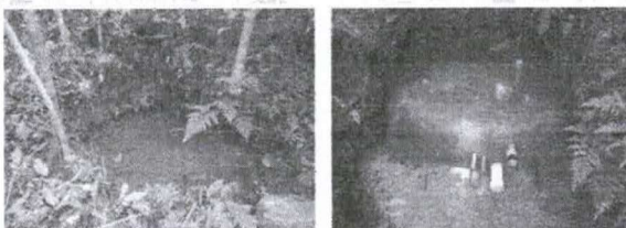
Figuras 33 e 34 - Trabalho de proteção de nascente realizado na propriedade do Sr. Cristiano Daniel da Silva - Município de Tomazina-PR, (aspecto antes e depois)

A variação na quantidade de material ocorre apenas em relação ao cimento e às pedras. Como pode ser visto, com uma técnica de baixo custo é possível realizar um trabalho que altera significativamente a qualidade da água de consumo no meio rural.