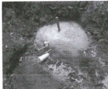
Figuras 27 e 28 - Trabalho de proteção de nascente realizado na propriedade do Sr. Bráulio Soares de Melo - Município de Tomazina-PR, (aspecto antes e depois)