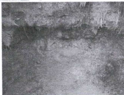
Figura 2 - Aspecto de outra nascente