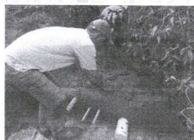
Figura 24 - Fechamento da nascente com a massa de solo-cimento

É dado o acabamento à caixa, fazendo o alisamento da superfície da massa. Na sequência, é realizada a finalização, utilizando os tampões para fechar o cano de esgotamento, os canos de abastecimento e o cano