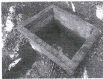
Figura 4 - Nascente com estrutura passível de ser aproveitada