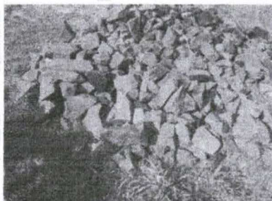
Figura 19 - Pedras adequadas para o trabalho

Devem ser utilizadas pedras firmes, que não se desmanchem, para que não ocorra a vedação interna da nascente (Figura 19). Nesse sentido, preferencialmente devem ser escolhidas as pedras basálticas, vulgarmente conhecidas como pedra-ferro, ou pedras de granito. Essas pedras devem ser colocadas cuidadosamente, uma a uma, e não jogadas (Figura 20). Deve-se tomar extremo cuidado para não obstruir o(s) “olho(s) d’água” e também atentar para que as pedras sejam assentadas de forma a criar vãos entre uma e outra.