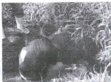
Figura 13 - Reboco das paredes do barranco

Geralmente as paredes do barranco ao redor das nascentes tendem a desmoronar, o que determinaria o comprometimento do trabalho. Dessa forma, utilizando-se a massa de solo-cimento, faz-se o reboco das paredes (Figura 13), tomando-se o cuidado de deixar livre o(s) “olho(s) d’água” (Figura 14).