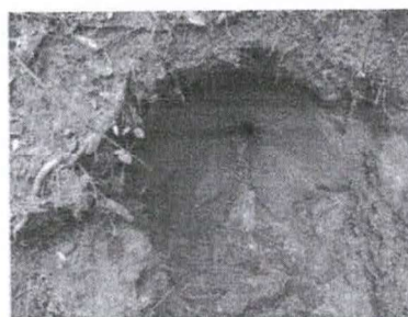
Figura 14 - Parede rebocada no entorno do “olho d’água da nascente