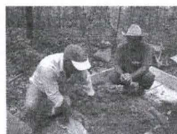
Figura 12 - Formação de pequenas bolas