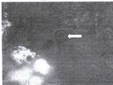
Figura 8 - "Olho d'água"