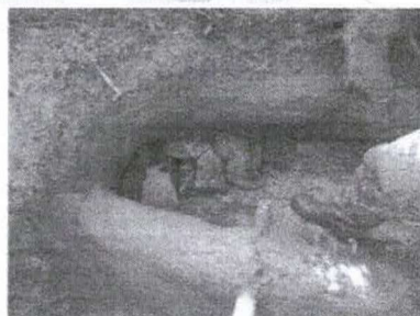
Figura 26 - Aspecto da proteção concluída, observando-se os canos devidamente fechados