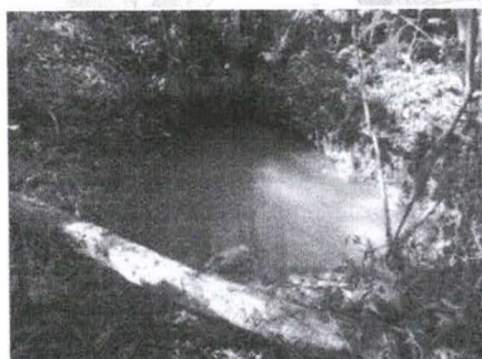
Figura 1 - Localização da nascente

O trabalho inicia-se com a localização exata das nascentes que, quase sempre, já possuem algum tipo de estrutura ao seu redor, porém, dificilmente essas estruturas podem ser aproveitadas. O aproveitamento ou não depende de uma análise prévia, caso a caso.