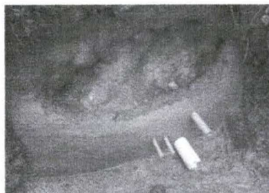
Figura 21 - Aspecto da nascente antes da colocação das pedras

Avenida Tapejara, 88 – Centro - CEP 87.780-000 - Fone: (044) 3431 8000 Paraíso do Norte – Estado do Paraná - CNPJ: 75.476.556/0001-58 www.paraísodonorte.atende.net - e-mail: engenharia@paraísodonorte.pr.gov.br urbanismo@paraísodonorte.pr.gov.br