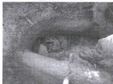
Figura 20 - Início do assentamento das pedras

Outro cuidado a ser tomado é o de que essas pedras estejam limpas, de forma a não levar resíduos para o interior da nascente. Quando o espaço interno já estiver quase totalmente preenchido pelas pedras, é a hora de se instalar o cano de suspiro (50 mm de diâmetro), por onde será realizada a introdução periódica de solução para a desinfecção da nascente (hipoclorito de sódio), conforme pode ser visto na Figura 22.