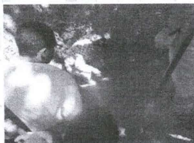
Figura 7 - Localização do "olho d'água"

Uma vez preparado o local, deve-se fazer a localização exata do "olho d'água".