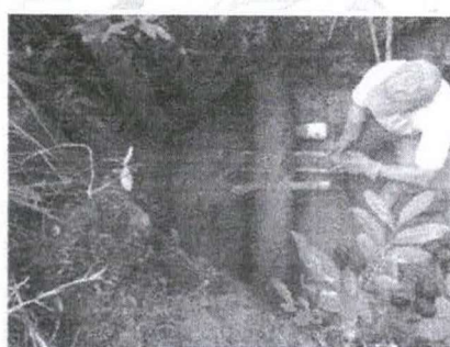
Figura 18 - Assentamento do cano ladrão