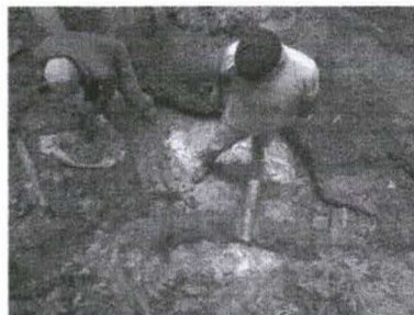
Figura 16 - Construção da barragem no momento da colocação do cano de esgotamento

Da mesma forma, ainda na parede da barragem, pouco acima dos canos de abastecimento, será instalado um cano ladrão (Figura 18), com o diâmetro de 50 mm, que, como o próprio nome diz, terá como função o escoamento da água excedente, não utilizada. Esse cano, em sua boca externa, será vedado com uma tela plástica, para impedir a entrada de pequenos animais no interior da nascente, porém sem impedir a saída da água.