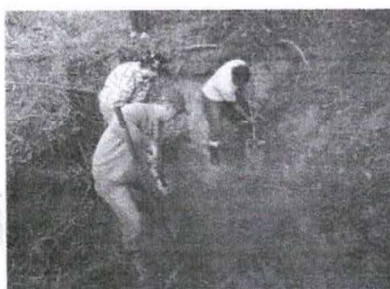
Figura 5 - Retirada de estrutura pré-existente e início de abertura de vala de escoamento

Localizada a nascente, a primeira ação a ser desenvolvida é a limpeza do seu entorno assim como a abertura de valas de escoamento da água empossada, de forma a permitir um fácil acesso para a execução dos trabalhos. Nesse momento é realizada também a retirada das estruturas pré-existentes que não serão aproveitadas.