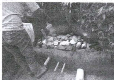
Figura 23 - Cal hidratada sendo esparramado sobre as pedras

Concluído o assentamento das pedras, que deve ser feito até a altura da barragem, e instalado o cano suspiro, faz-se a desinfecção inicial da nascente. Essa operação é necessária em função de todo o manuseio que foi realizado até o momento e que determina a contaminação da área. A desinfecção inicial é realizada esparramando-se cal hidratada sobre as pedras, conforme pode ser visto na Figura 23. Após a distribuição da cal, deve-se colocar mais uma camada de pedras menores e sobre essas uma camada farta da massa de solo-cimento, que determinará a impermeabilização superior da nascente, ou seja, formará o teto da caixa de proteção (Figura 24).