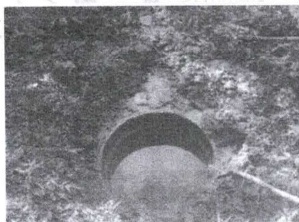
Figura 3 - Nascente com estrutura pré-existente, que deve ser retirada