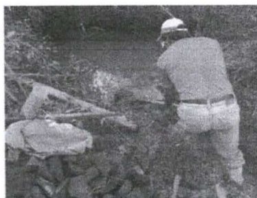
Figura 6 - Abertura de vala de escoamento

Uma vez preparado o local, deve-se fazer a localização exata do "olho d'água".