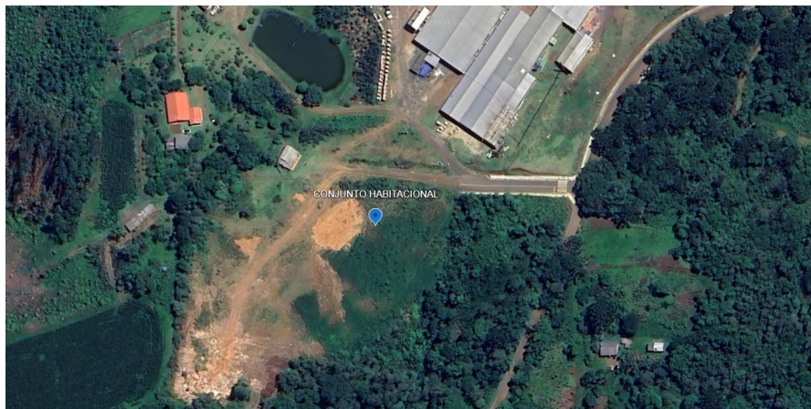
Figura 3: Localização da obra da licitação 1.

Ao adotar essas orientações para o uso sustentável da água e da energia, é possível reduzir o impacto ambiental, promover a conservação dos recursos naturais e contribuir para um futuro mais sustentável e resiliente.