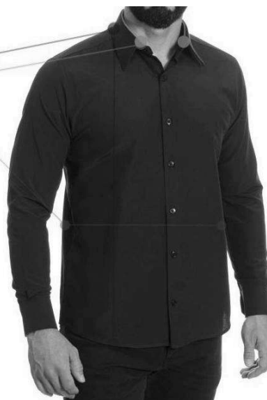
Figura 1 - TABELA DE MEDIDAS CAMISA MASCULINA ( ITEM 05, LOTE 01)