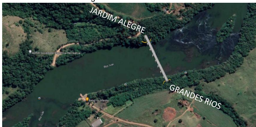
Figura 1 – Local da obra

As obras previstas em projeto tratam da construção da ponte sobre o Rio Ivaí entre Jardim Alegre e Grandes Rios. A ponte a ser implantada visa facilitar a ligação entre os municípios, dado que, atualmente, a travessia do rio é feita por meio de balsa. A Figura 1 apresenta o local das obras previstas.