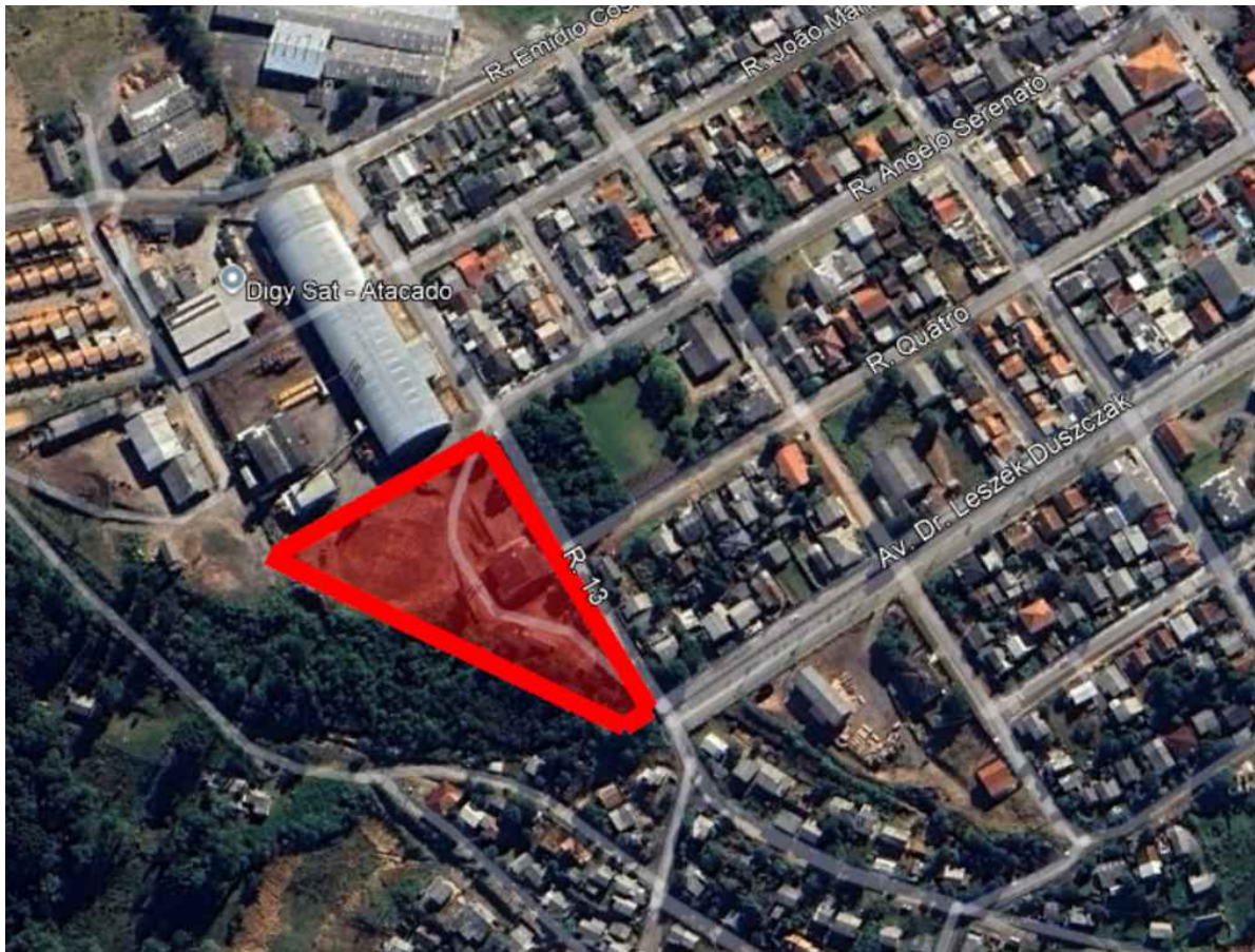
3 IMAGEM DE SATÉLITE - GOOGLE EARTH ESCALA : GRÁFICA