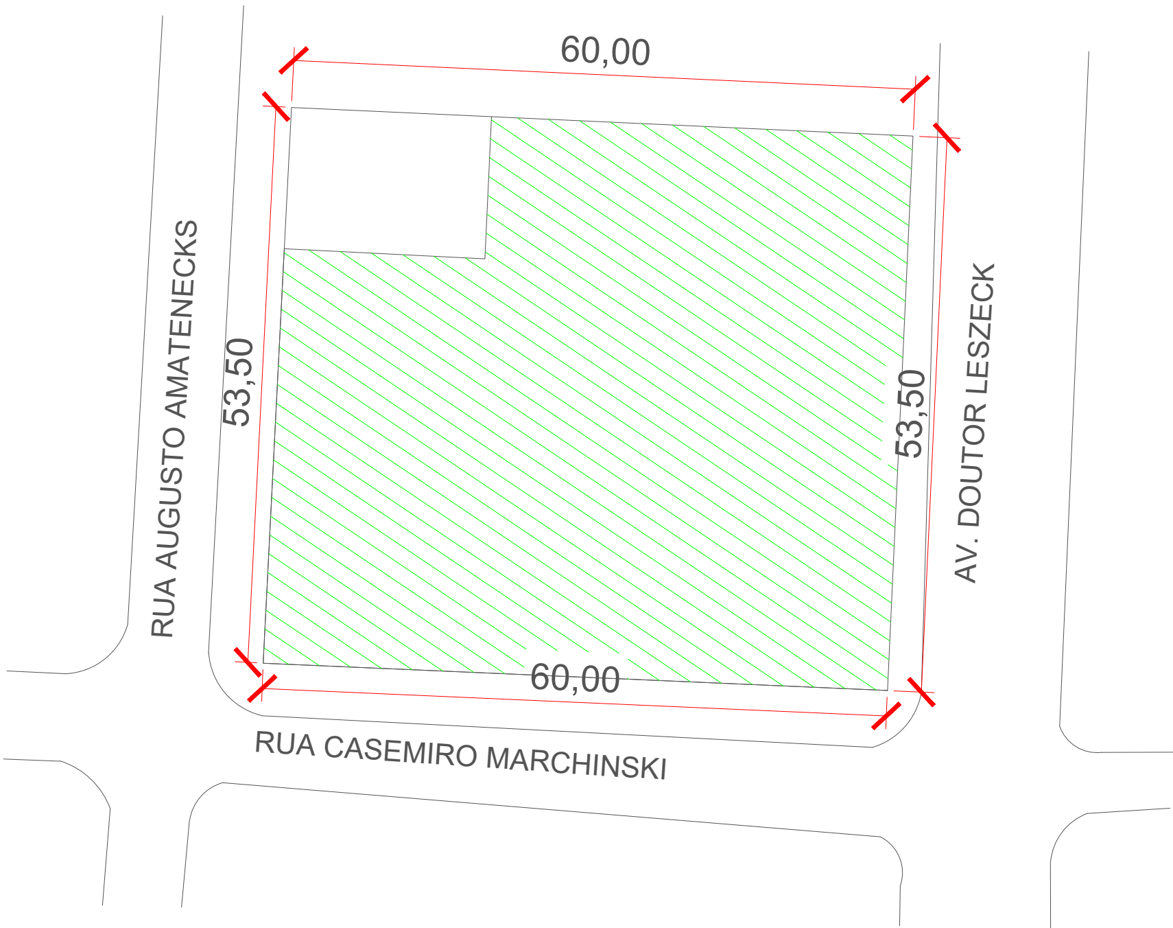
1 LOCALIZAÇÃO 16 LOTES ESCALA : 1/500