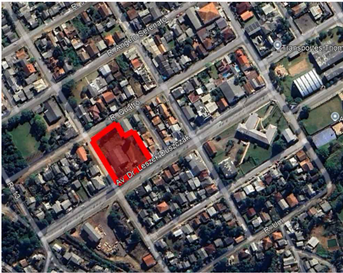
3 IMAGEM DE SATÉLITE - GOOGLE EARTH ESCALA : GRÁFICA