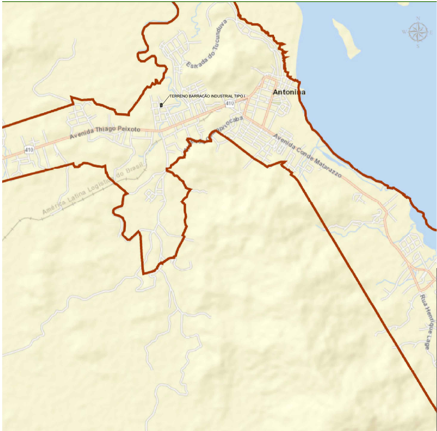
SITUAÇÃO NO PERÍMETRO URBANO SEM ESCALA