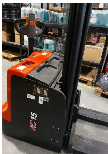
Visão geral esquerda e detalhes