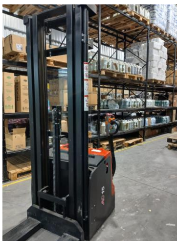
Visão Geral Direita