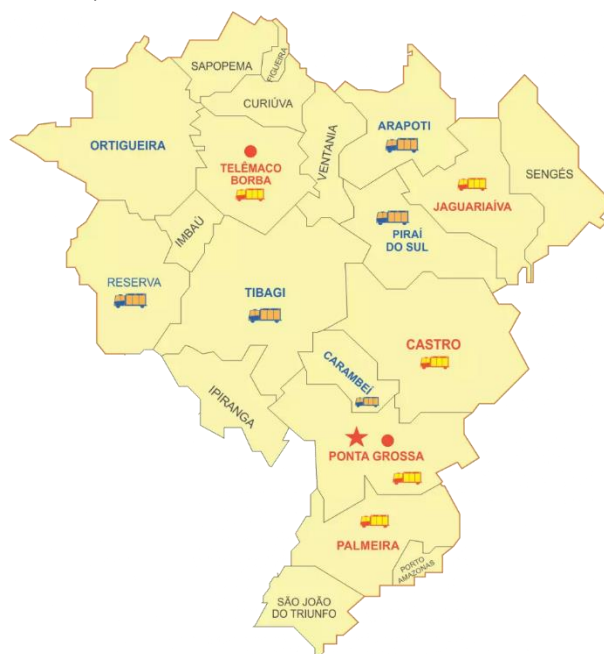
Figura 1 - área de atuação do 2º GB

O 2º Grupamento de Bombeiros – Fração de Ponta Grossa possui atualmente 3 postos de bombeiros em atividade operacional (Quartel Central, Nova Rússia e Uvaranas) e 1 posto de bombeiros em vias de ativação (Distrito Industrial), mantendo em regime de trabalho ininterrupto e contínuo, 18 bombeiros militares por dia. Dentre esses, 4 viaturas do tipo Auto-Bomba Tanque Resgate, 2 viaturas Auto-Ambulância, 3 viaturas Auto-Busca Salvamento e 2 Embarcações compõem a frota operacional que atende toda a gama de atividades definidas por lei ao Corpo de Bombeiros Militares do Paraná, a saber proteção pessoal e patrimonial da sociedade e do meio ambiente, por meio de ações de prevenção, combate a incêndios urbanos e florestais, salvamento de pessoas e animais, atendimento pré-hospitalar e ações de defesa civil (BRASIL, 1988). Ainda, o efetivo total da fração de Ponta Grossa compreende 120 militares que desempenham funções meio e fim (SYSEFETIVO, 2024). Ainda, a totalidade do 2º Grupamento de Bombeiros é responsável pela primeira resposta de toda a área dos Campos Gerais, correspondendo 18 municípios, com área de 25.000km 2 e população de aproximadamente 800.00 habitantes (IBGE, 2021).