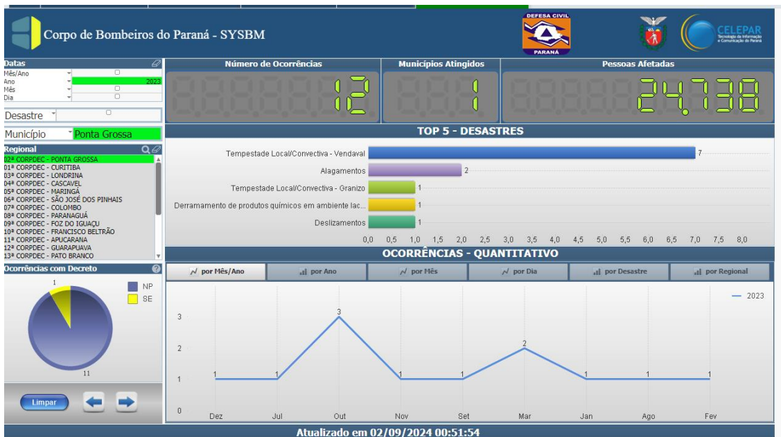
Figura 4 - ocorrências de desastres registradas no ano de 2023 em Ponta Grossa

Também, dentro das missões constitucionais do Corpo de Bombeiros figura o atendimento e manejo de situações de desastre, situações onde em conjunto com a Defesa Civil Municipal, a fração de Ponta Grossa desempenhou a primeira resposta em tempestades, alagamentos e vendavais que atingiram diretamente 24.000 habitantes da cidade (SISDC, 2024). Apesar do robusto sistema integrado de resposta a desastres, as coordenadorias municipais carecem de operação ininterrupta, cabendo aos militares o pronto atendimento das situações de risco.