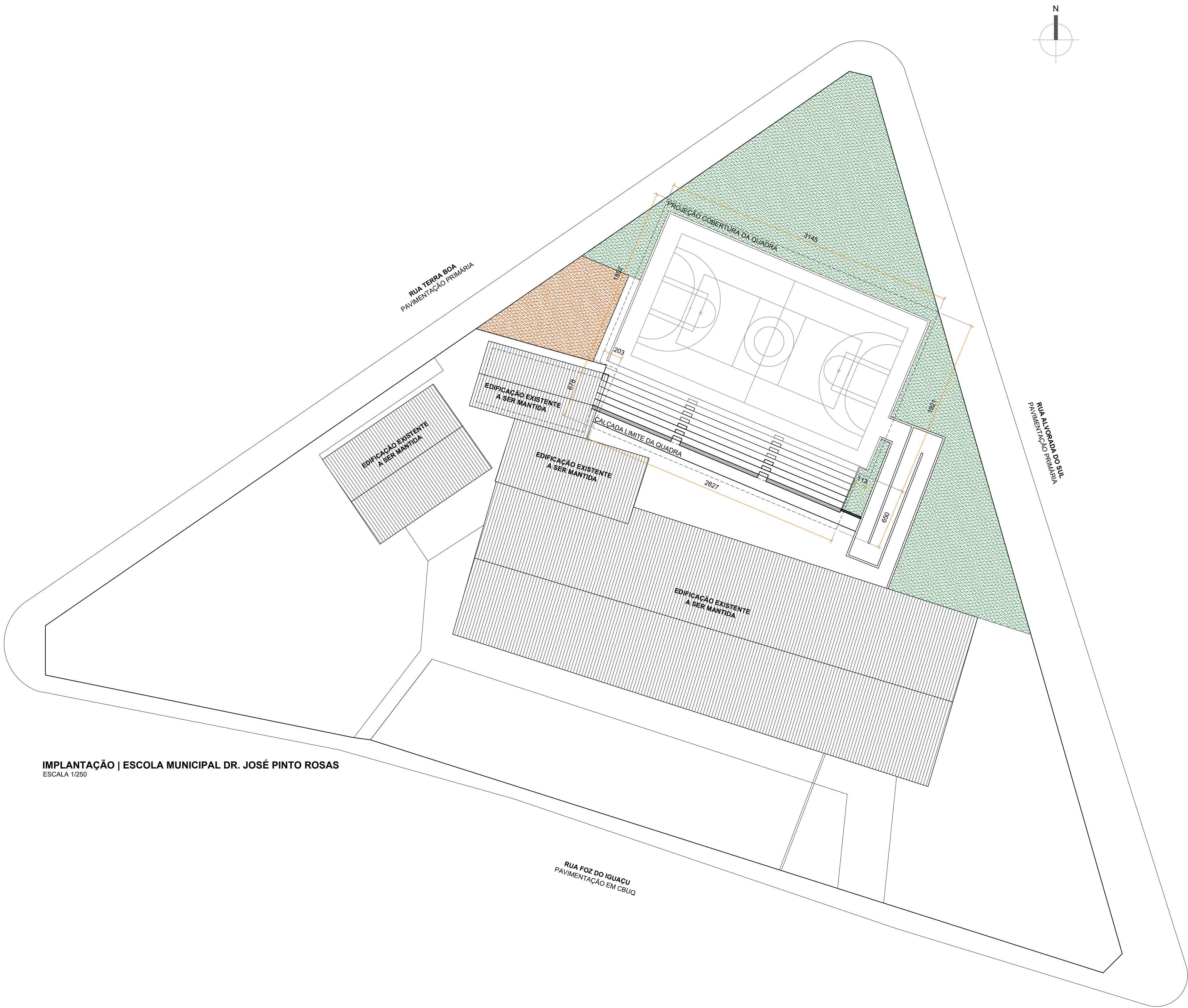
IMPLANTAÇÃO | ESCOLA MUNICIPAL DR. JOSÉ PINTO ROSAS ESCALA 1/250