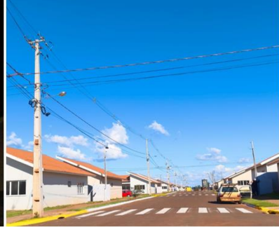
FOTOS - RUA ASSUNÇÃO