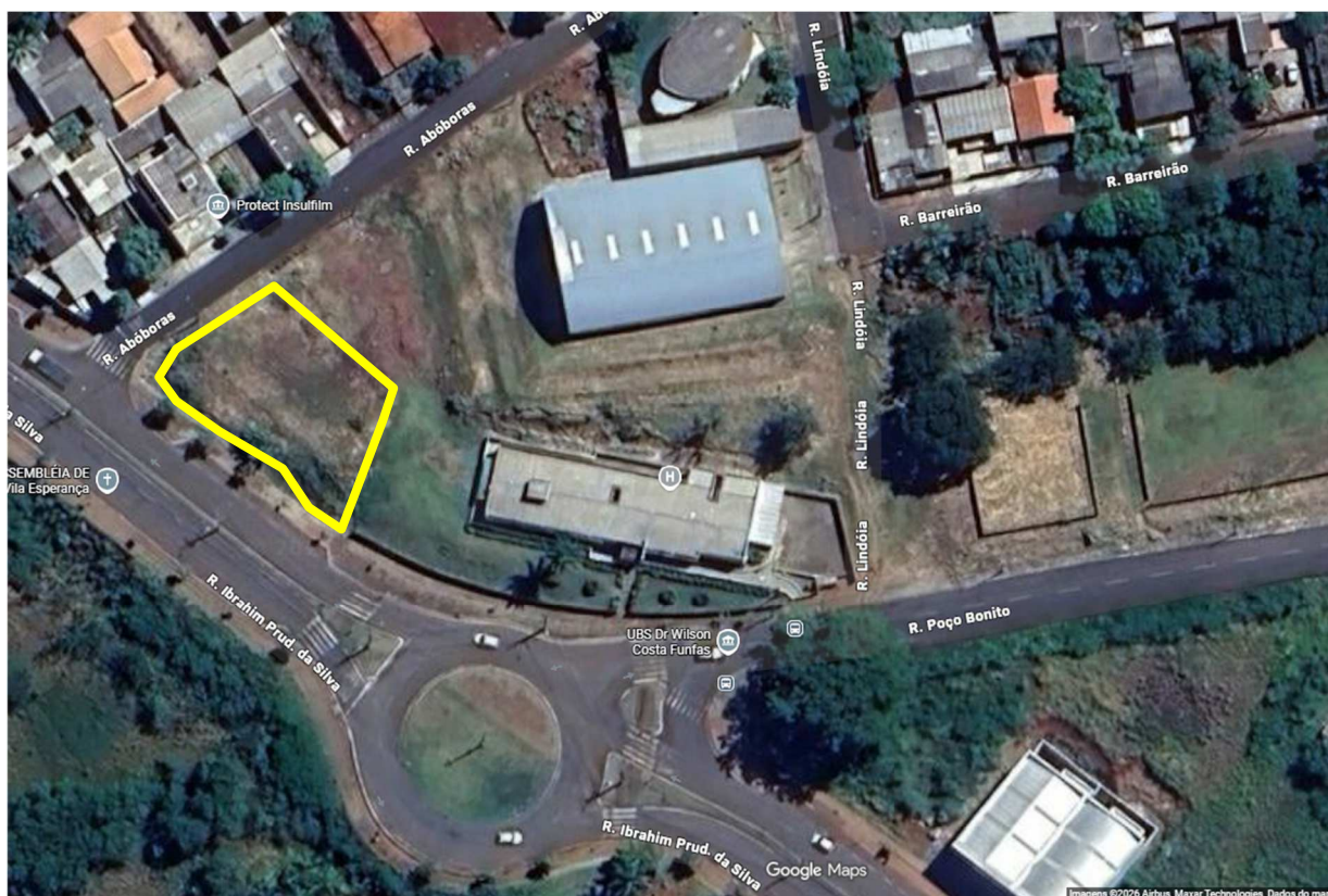
Rua Ibrahim Prudente da Silva, nº 1245 – Vila Esperança, Ibiporã – PR