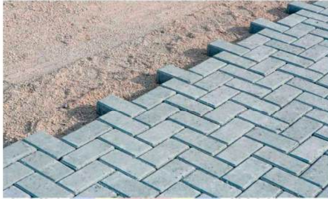
Figura 02 – INTERTRAVADO TIPO PAVER DRENAGEM

As calçadas externas da obra e o passeio receberão piso intertravado de concreto tipo PAVER DRENANTE na cor cinza nas dimensões 6x10x20. Terão base regularizada, assentado sobre pó de pedra ou areia e rejuntado com areia fina (figura 02).