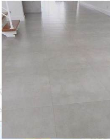
Figura 01 – Piso porcelanato cimentado

O assentamento do piso interno, será feito com argamassa indicada pelo fabricante. Efetuar a limpeza prévia das peças, que devem estar limpas e isentas de materiais estranhos. A pasta de assentamento será constituída de argamassa de cimento com cola para assentamento interno ou outra recomendada pelo fabricante, especial flexível, aplicada com desempenadeira de aço dentada, da seguinte forma: as peças devem ser assentadas a seco, sem a necessidade de imersão prévia em água, pressionando-as adequadamente para sua perfeita aderência.