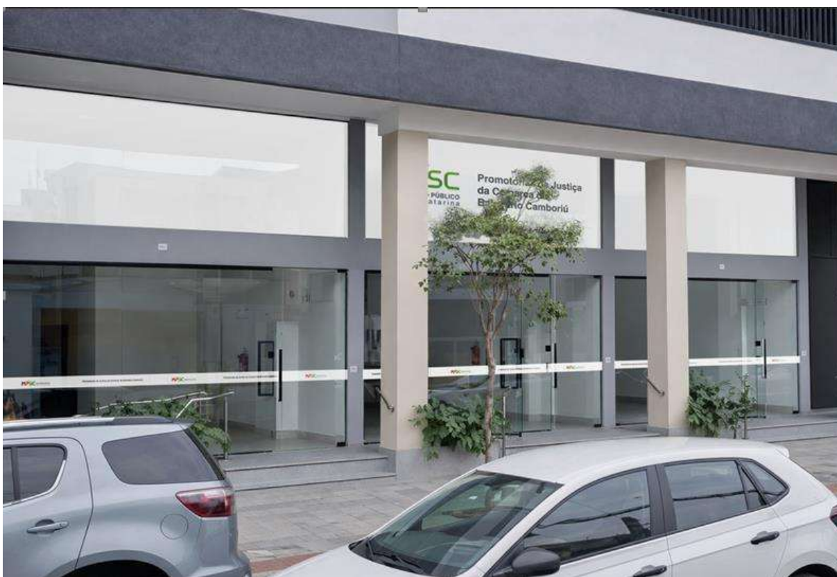
Imagem 3, 4 e 5: Exemplos de layouts de placas de porta e foto de placas já instaladas em outro local.