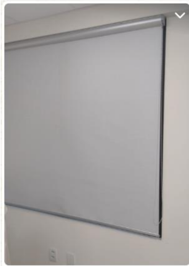
1,90 de largura por 1,60 de altura