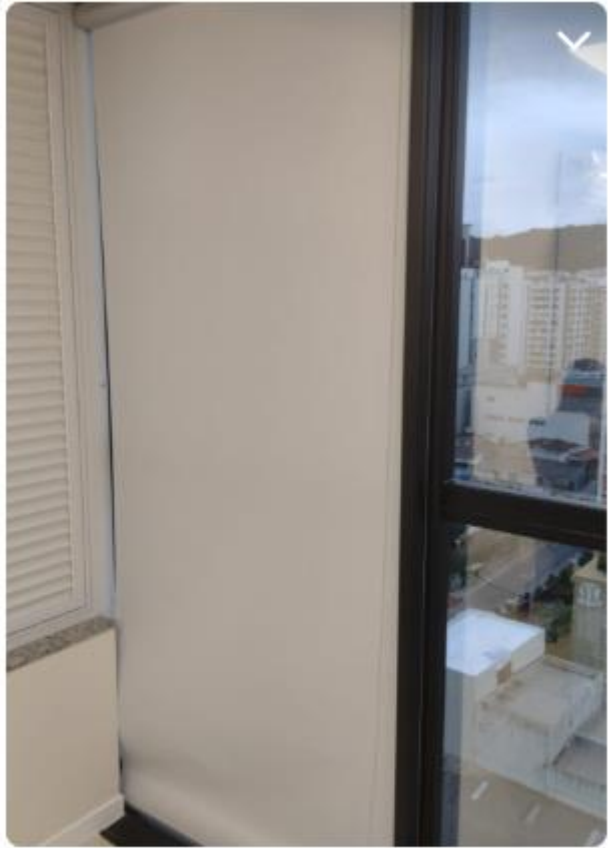
2,30 de altura e 1,00 de largura