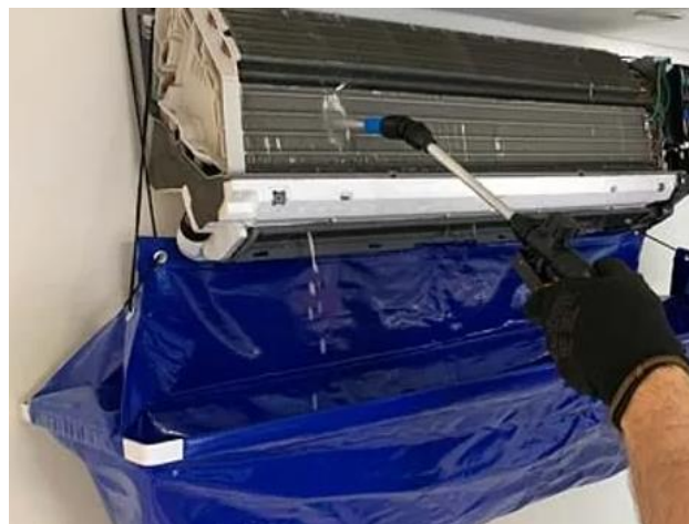
Figura 4: Lavagem do Item 01