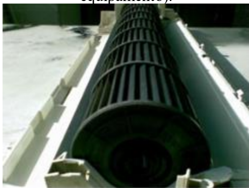
Figura 5: Foto da parte interna com o rotor limpo do Item 01.