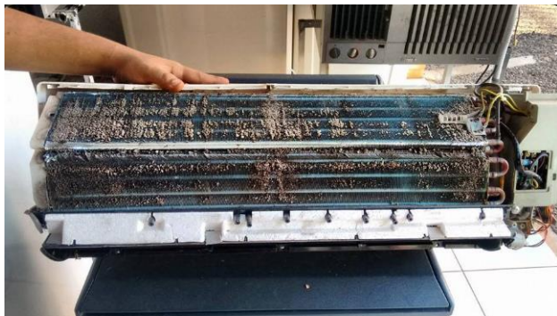
Figura 1: Evaporador (Item 01) com muita sujeira antes da limpeza (procurar se possível mostrar número do património) / (apresentar fotos para cada equipamento onde a manutenção foi realizada).