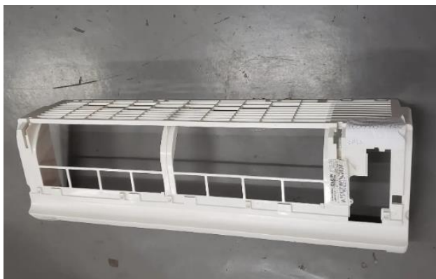
Figura 3: Desmontagem do Item 01 (Foto deve conter data e número do patrimônio do equipamento).