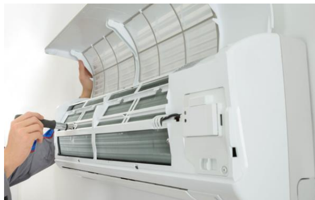
Figura 6: Posição da CD-02.

Obs.: Deverá ser feito a mesma documentação fotográfica e por vídeos para a limpeza da condensadora.