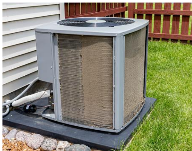
Figura 2: Condensadora (item 01) com muita sujeira acumulada, resultando em falhas de comunicação e erros.

Obs.: Os relatos fotográficos devem ser ajustados de acordo com cada caso, e devem possibilitar o perfeito entendimento do problema que foi solucionado.