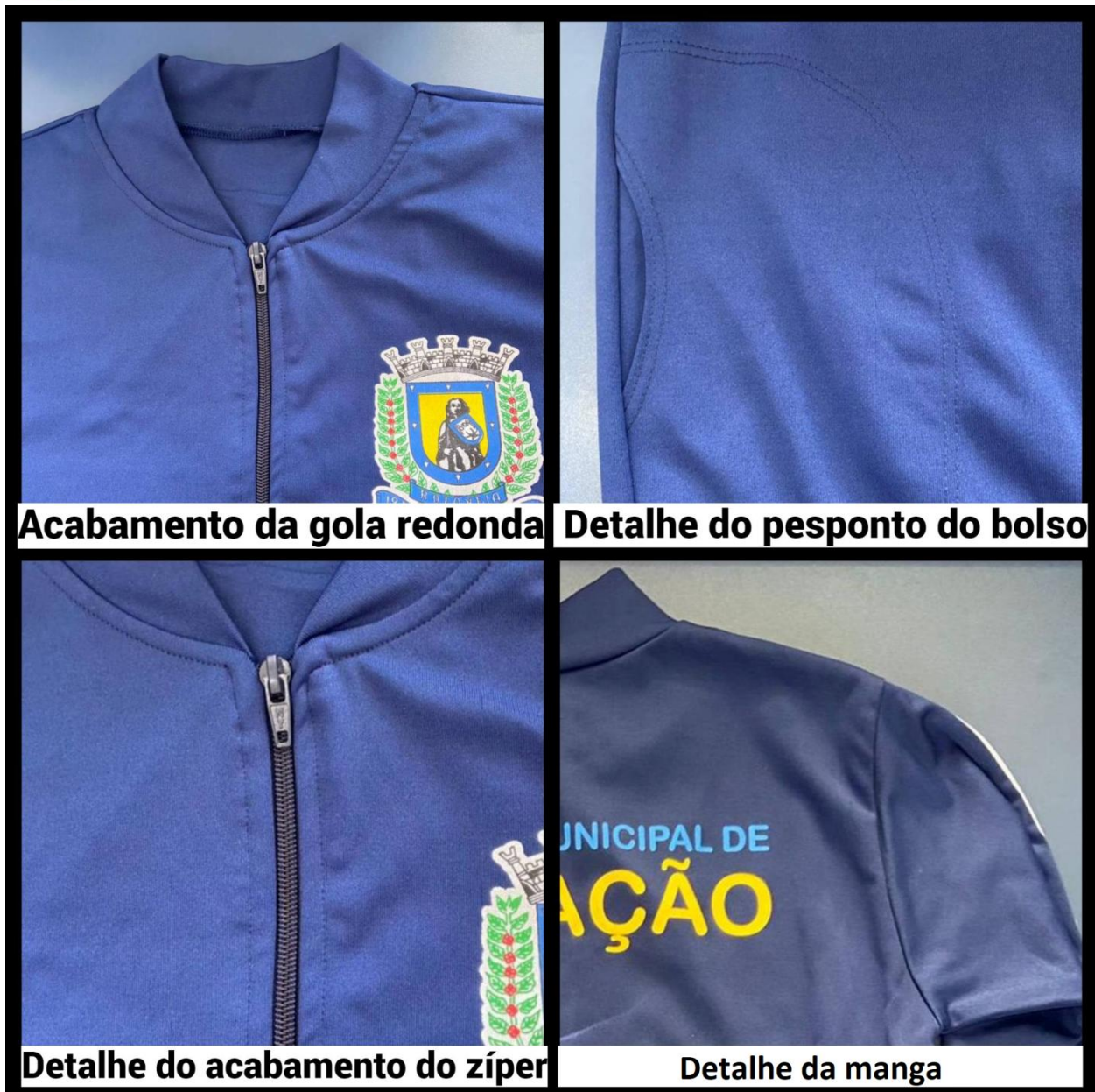
Acabamento da gola redonda