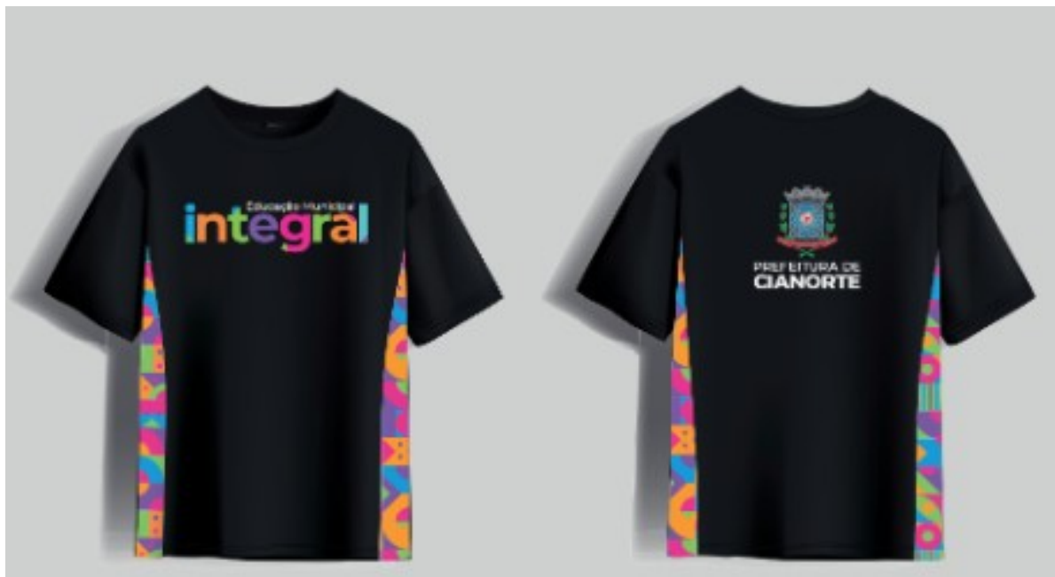
TABELA DE TAMANHOS DAS CAMISETAS

Camiseta Esportiva: Modelo: Camiseta esportiva de manga curta, com corte reto e gola redonda reforçada indicada para uso em atividades físicas intensas. Tecido: Poliéster Dry Fit, 100% poliéster, gramatura 130 g/m 2 , proteção UV 25%, com propriedades respiráveis, leveza e rápida secagem. Frente: Cor predominante: preta. Logotipo “ Educação Municipal Integral ” centralizado no peito. A palavra “ Integral ” tem cada letra em uma cor diferente, criando um efeito vibrante e visualmente atrativo. Laterais: Faixas verticais com padrões geométricos estilizados, em cores como laranja, rosa, roxo, azul e amarelo. As faixas descem dos ombros até a base da camiseta, contrastando com o fundo preto. Costas: Parte superior com o brasão oficial da Prefeitura de Cianorte, centralizado. Abaixo do brasão, a inscrição: “ PREFEITURA DE CIANORTE ”, em letras brancas e maiúsculas. As faixas laterais coloridas continuam nas costas, preservando o design contínuo. Aplicação visual: Todos os elementos gráficos (logotipo, brasão, faixas) devem ser aplicados exclusivamente por sublimação, assegurando durabilidade, cores nítidas e conforto no uso esportivo.