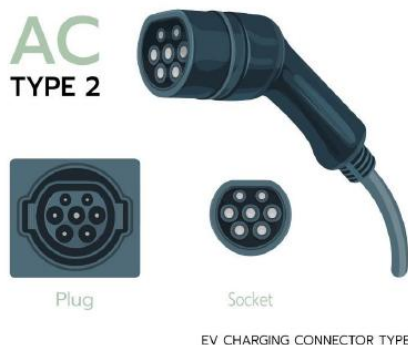
Figura 1 - Plug e socket do carregador tipo 2.

Carregador tipo Wallbox de 22KW no padrão europeu (tipo 2), conforme Figura 1: