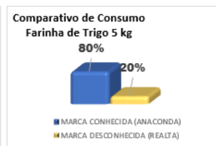
Figuras 4 e 5 – Comparativo de giro entre produtos.