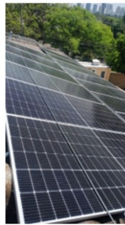
Teto Prédio lateral (2)