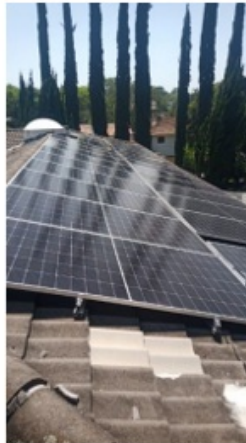
Teto Prédio lateral (1)