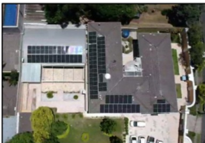
Sede do CRF-PR