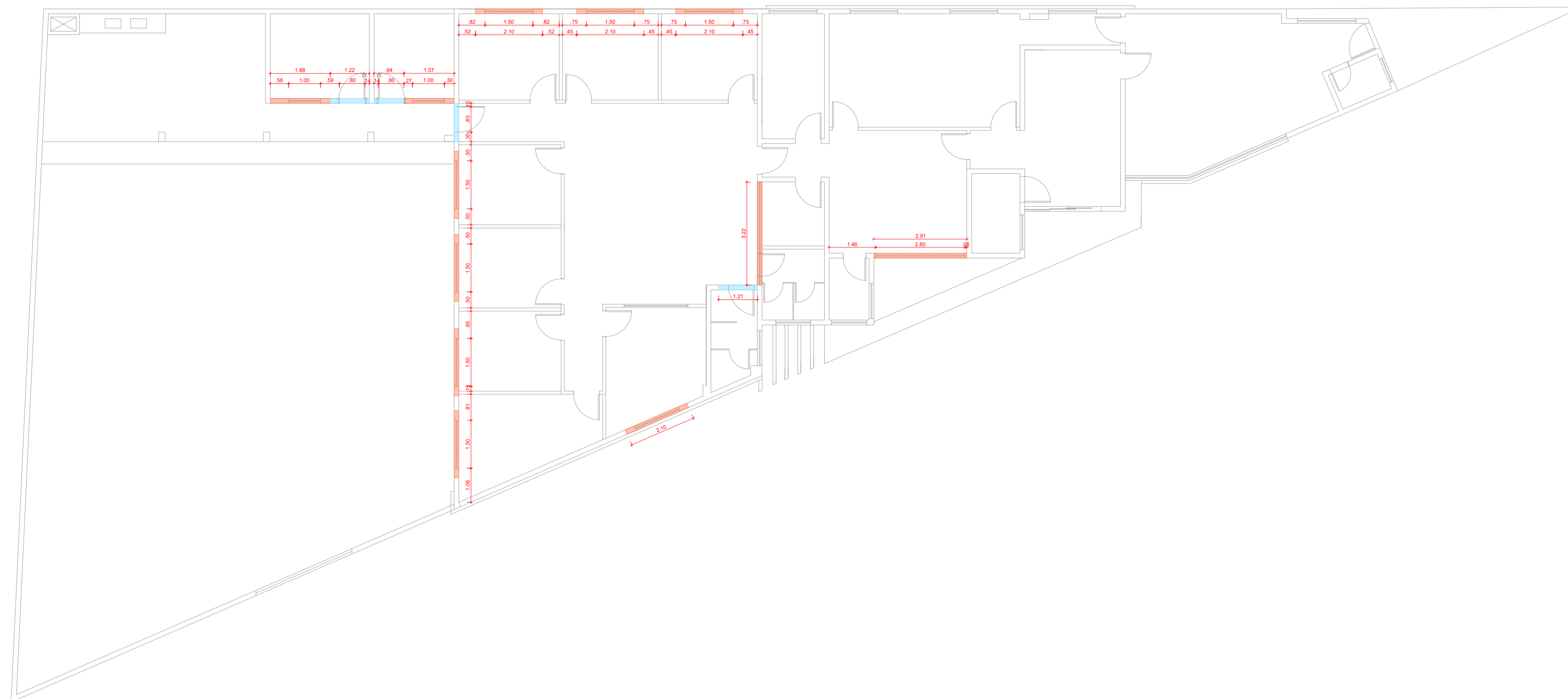
10 ESQUEMA DE VERGAS E CONTRAVERGAS ESCALA 1/100