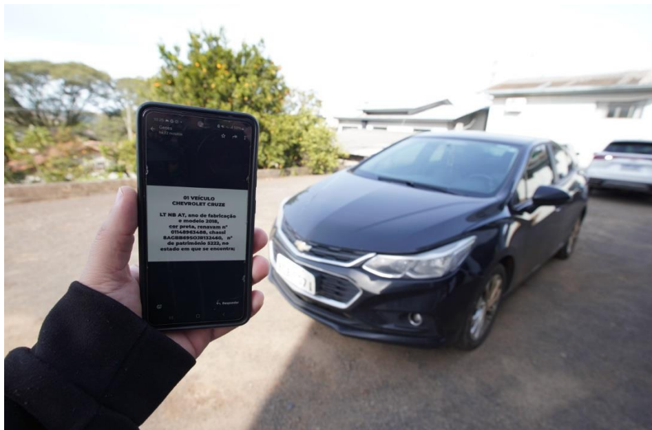
IMAGEM - 01 VEÍCULO CHEVROLET CRUZE, LT NB AT, ano de fabricação e modelo 2018, cor preta, renavam nº 01148963488, chassi 8AGBB69SOJR132460, nº de patrimônio 5222, no estado em que se encontra;