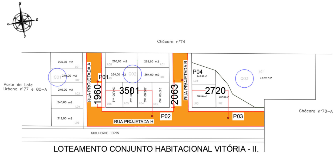
Figura 1: loteamento Vitória II.

Mapa de localização, com identificação dos pontos de coleta das amostras