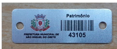
Figura 7 – Modelo de referência para plaqueta

OBS.: não será mais adotado o padrão RPC (Remetente Padrão Correios), portanto os envelopes deverão ser brancos e impressos somente com o timbre da Câmara.