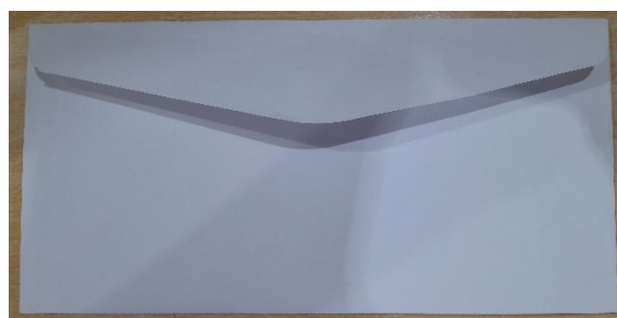
Figura 6 – Envelope – Verso

OBS.: não será mais adotado o padrão RPC (Remetente Padrão Correios), portanto os envelopes deverão ser brancos e impressos somente com o timbre da Câmara.