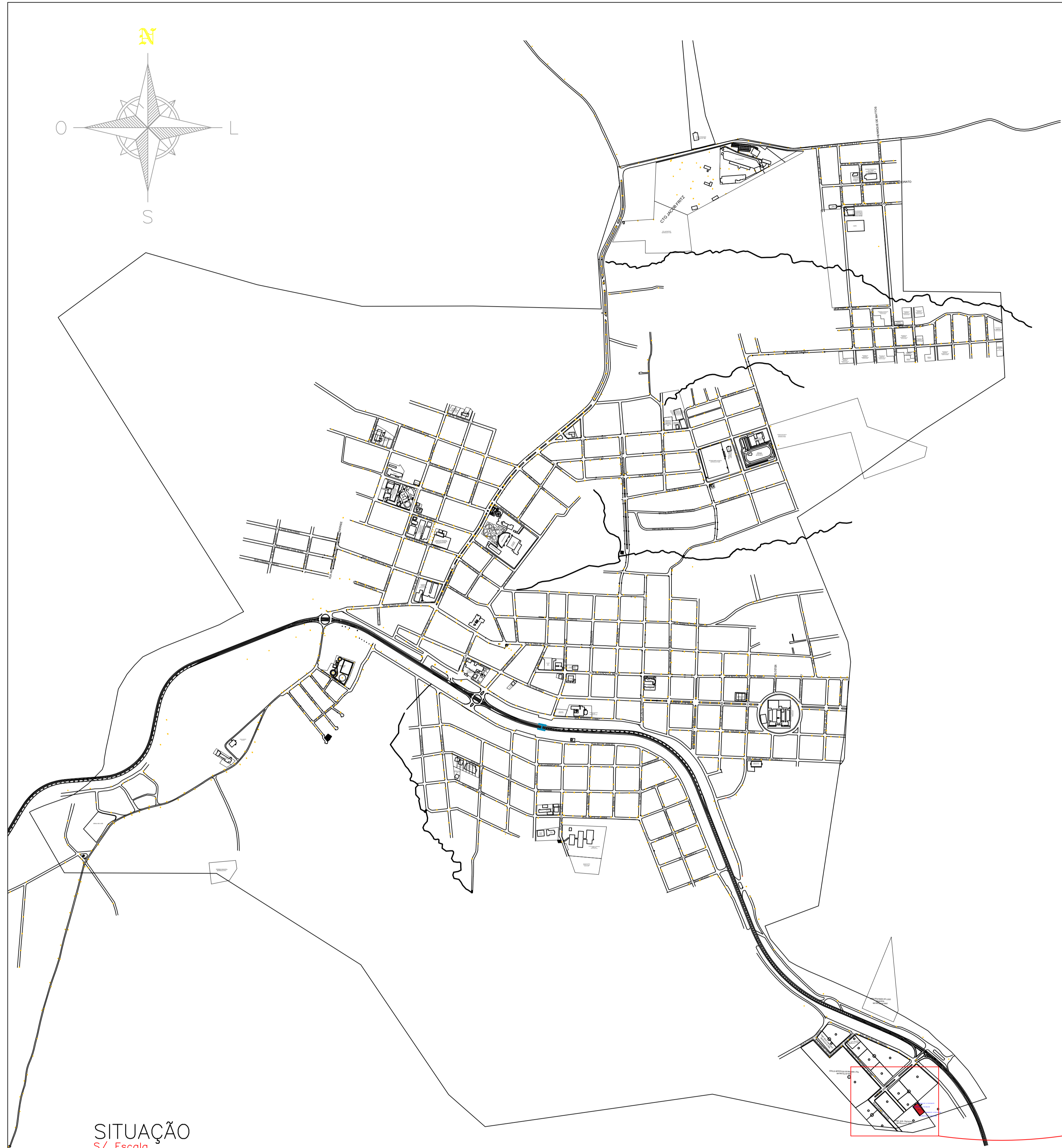
SITUAÇÃO S/ Escala