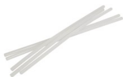
Cola quente grossa