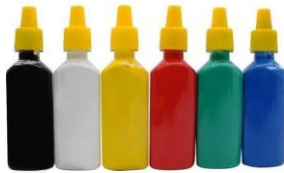
Cola com glitter