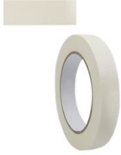
Frete kraft marrom