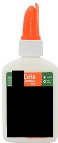
Cola de EVA