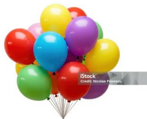
Cola quente fina