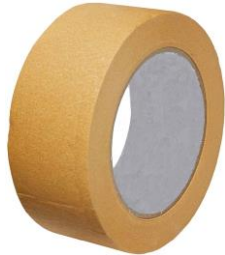
Fita adesiva 48mm X 50m