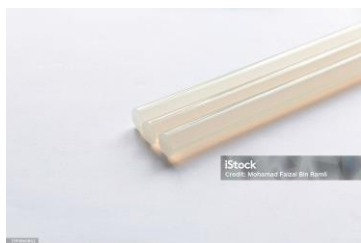
Cola 1 Kg