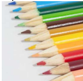
Lápis de escrever