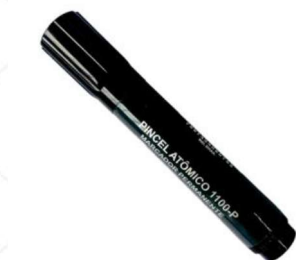
Pincel atômico vermelho