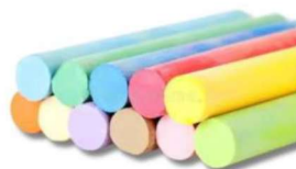
Lápis de cor com 12 unidades