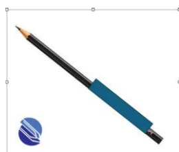
Pincel atômico azul