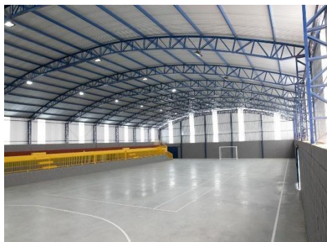
Figura 2 : Telha Metálica tipo aço galvanizado

CNPJ: 80.888.688/0001-27 www.luiziana.pr.gov.br E-MAIL: planejamento@luiziana.pr.gov.br FONE: (44) 3571-1854 - (44) 9 2002-3959 Av. Independência, nº1100 - Jd. Alvorada - Luiziana/PR