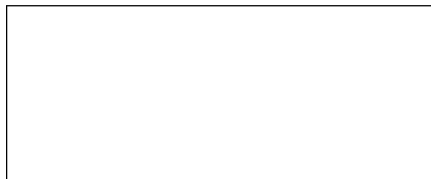
Jair Antônio Giumbelli Prefeito Municipal