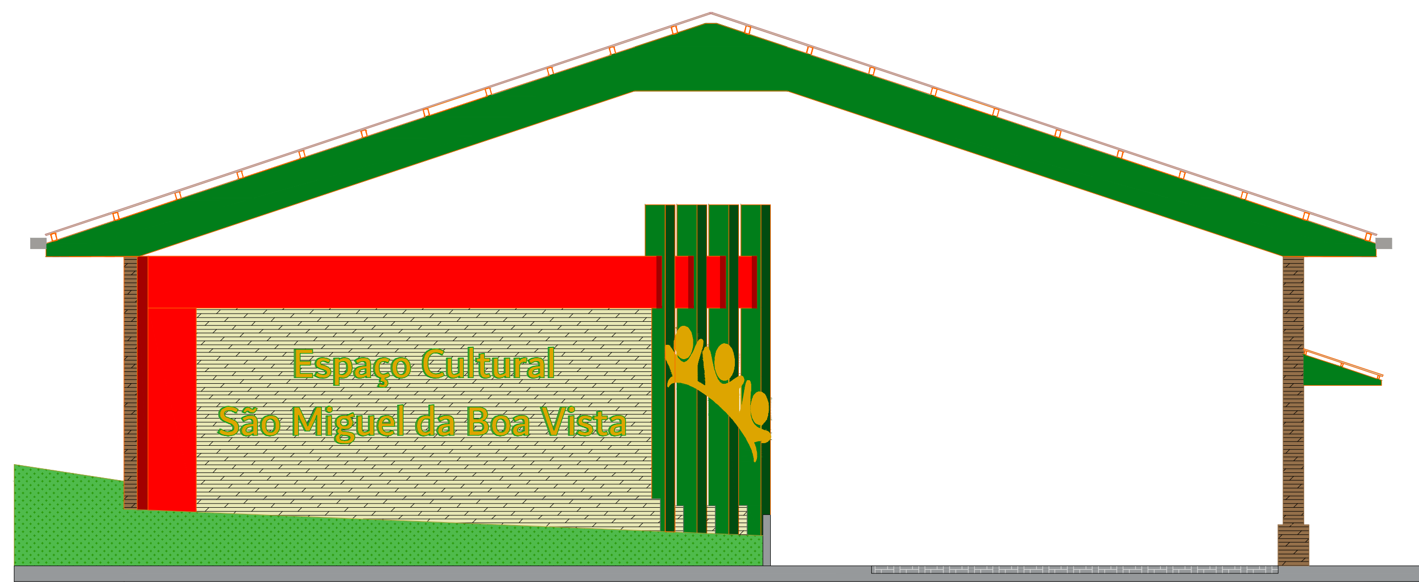
Elevação Fundos Escala= 1 : 75