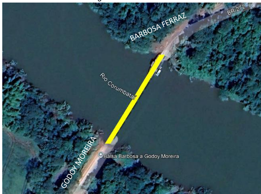
Figura 1 – Local da obra

As obras previstas em projeto tratam da construção da ponte sobre o Rio Corumbataí entre Godoy Moreira e Barbosa Ferraz. A ponte a ser implantada visa facilitar a ligação entre os municípios, dado que, atualmente, a travessia do rio é feita por meio de balsa. A Figura 1 apresenta o local das obras previstas.