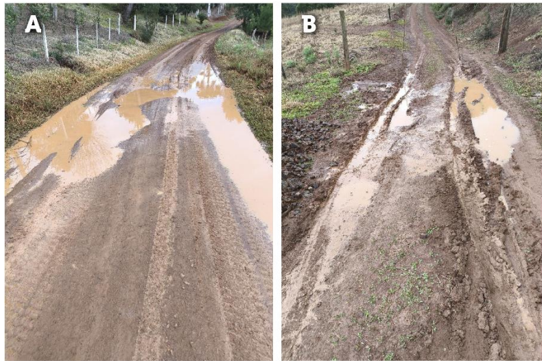
Figura 02 – Imagem “A” demonstrando um trecho de estrada pública e imagem “B” mostra acesso a uma residência.