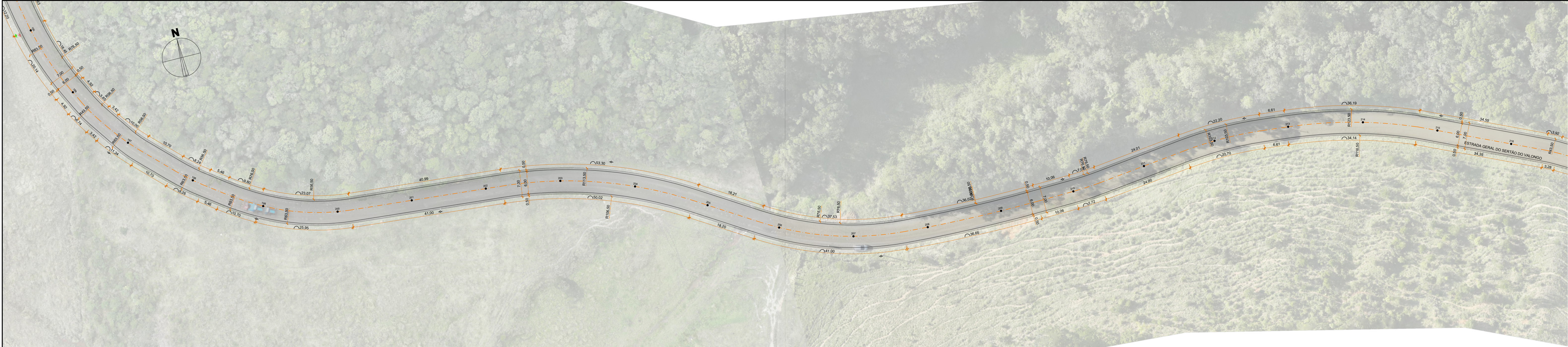
PLANTA GEOMÉTRICA ESCALA 1:500