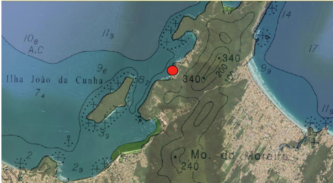
Figura 3 – Mapa da Enseada de Porto Belo com destaque para o local do projeto

As praias do litoral de Porto Belo servem como atracadouros para uma grande frota de embarcações da pesca artesanal e outras tantas com finalidade de lazer. Na praia do Araçá já existem algumas estruturas precárias destinadas a pesca artesanal, e o trapiche deverá servir como suporte ao embarque, armação e desembarque de pescados e eventuais serviços de apoio ao turismo.