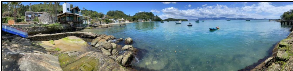
Figura 4 - Molhe na Foz do Rio Rebelo

As praias do litoral de Porto Belo servem como atracadouros para uma grande frota de embarcações da pesca artesanal e outras tantas com finalidade de lazer. Na praia do Araçá já existem algumas estruturas precárias destinadas a pesca artesanal, e o trapiche deverá servir como suporte ao embarque, armação e desembarque de pescados e eventuais serviços de apoio ao turismo.