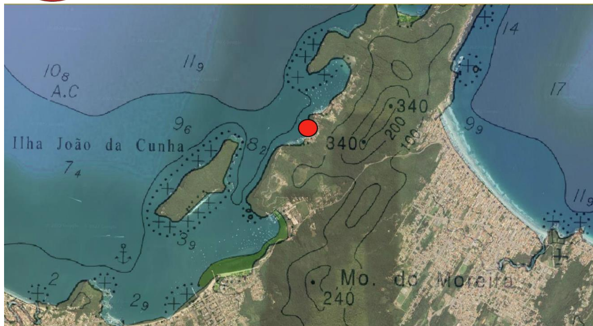
Figura 3 – Mapa da Enseada de Porto Belo com destaque para o local do projeto

As praias do litoral de Porto Belo servem como atracadouros para uma grande frota de embarcações da pesca artesanal e outras tantas com finalidade de lazer. Na praia do Araçá já existem algumas estruturas precárias destinadas a pesca artesanal, e o trapiche deverá servir como suporte ao embarque, armação e desembarque de pescados e eventuais serviços de apoio ao turismo.