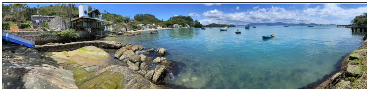
Figura 4 - Molhe na Foz do Rio Rebelo

As praias do litoral de Porto Belo servem como atracadouros para uma grande frota de embarcações da pesca artesanal e outras tantas com finalidade de lazer. Na praia do Araçá já existem algumas estruturas precárias destinadas a pesca artesanal, e o trapiche deverá servir como suporte ao embarque, armação e desembarque de pescados e eventuais serviços de apoio ao turismo.