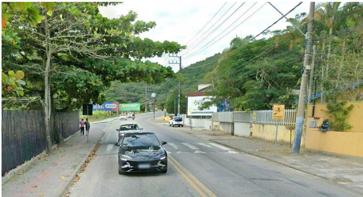
Figura 3 – Trecho da Avenida Governador Celso Ramos com maior incidência de acidentes (trecho entre a Servidão Berto Costa e a Rua Oscar Bayer)