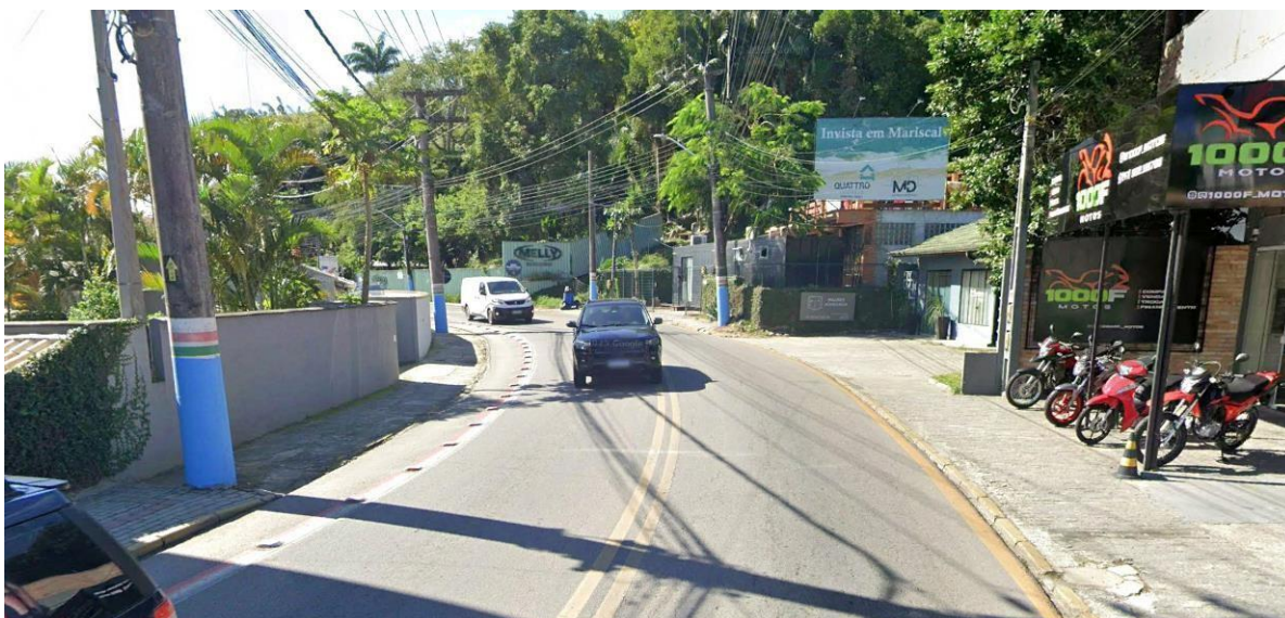
Figura 4 – Localização dos pontos críticos de acidentes na Avenida Governador Celso Ramos (trecho entre a Rua João Carlos e a Rua Eduardo Miranda)

ESTE DOCUMENTO FOI ASSINADO EM: 18/03/2026 14:34 -03:00 -03 PARA CONFERÊNCIA DO SEU CONTEÚDO ACESSAR: https://c.ipm.com.br/rip62be3202f9a1d