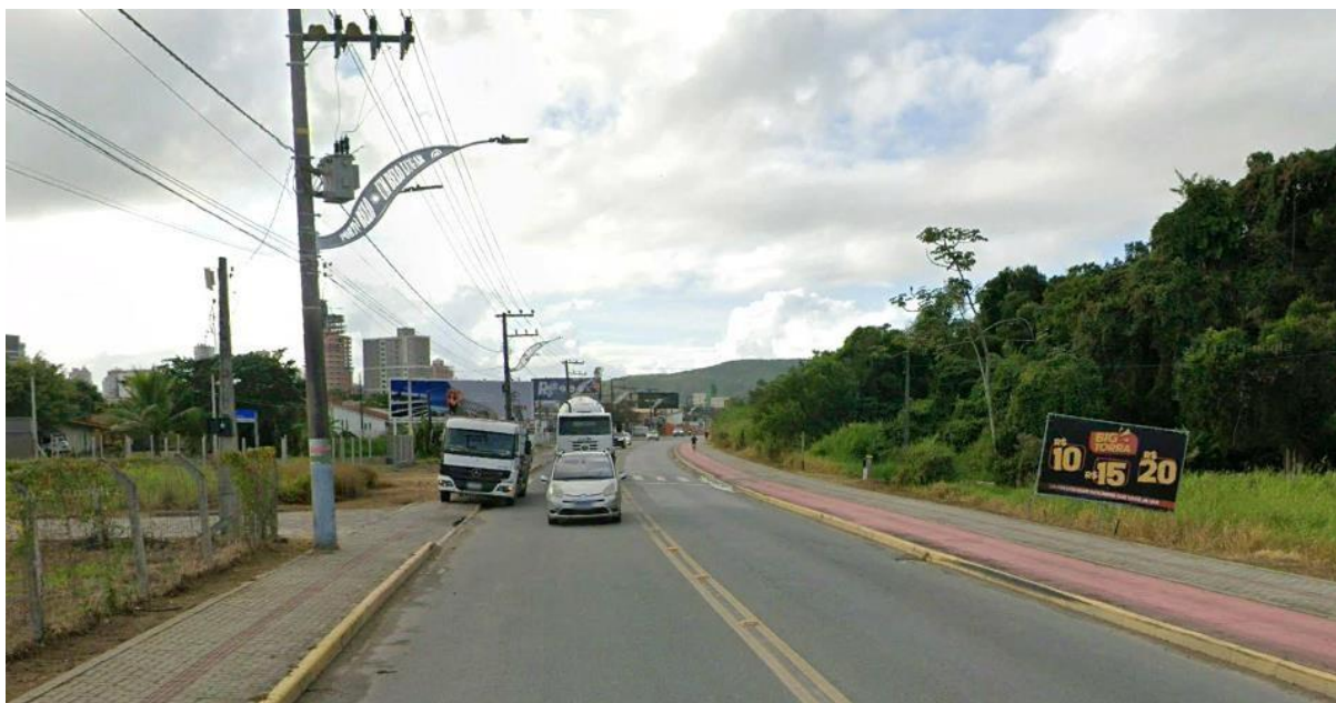
Figura 5 – Ponto crítico de acidentes na Avenida Governador Celso Ramos (trecho próximo ao acesso à Avenida Silvio Camargo)