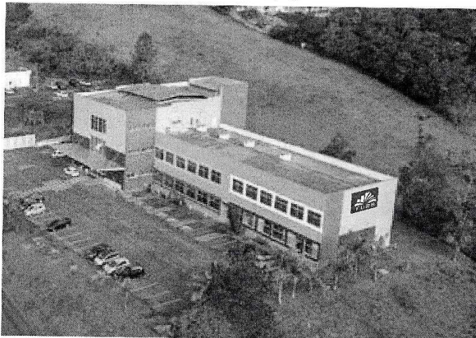
Fachada vista rua Samuel Morse