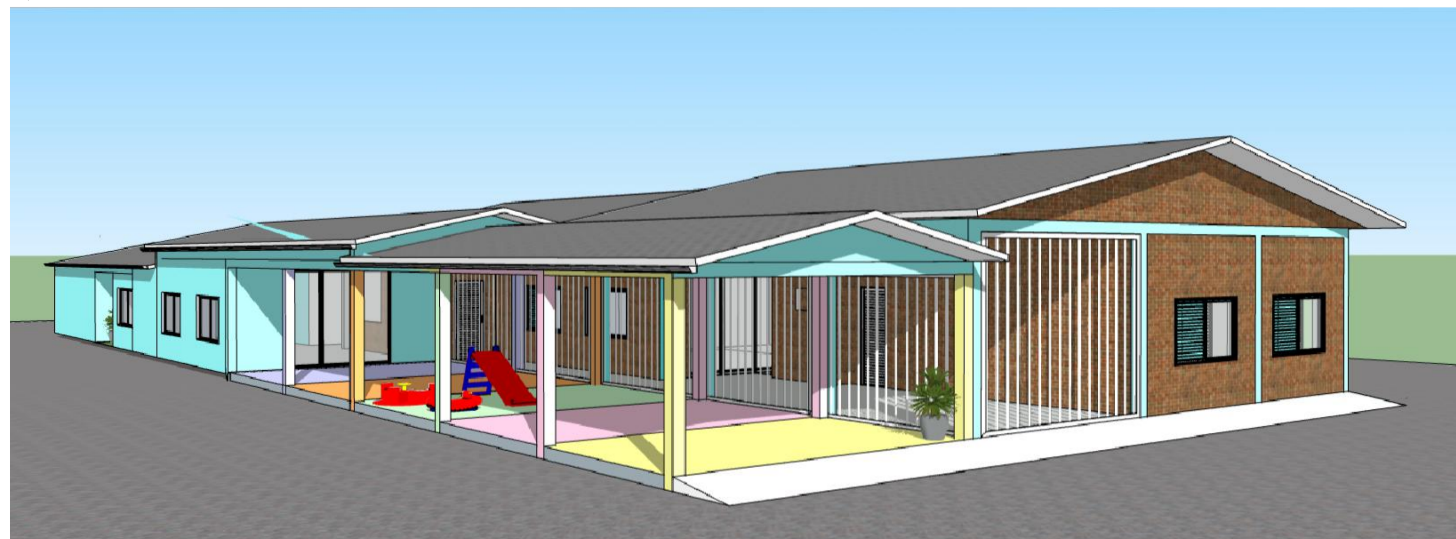
VISTA Sem Escala

O PISO POLIDO DEVERÁ SER DE TAL MANEIRA A NÃO COMPROMETER A SEGURANÇA DE QUEM TRANSITA NO LOCAL. AS CORES DO PISO DEVERÃO SER PINTADOS COLORIDOS, CONFORME PROJETO. AS RAMPAS EXECUTADAS NÃO DEVEM POSSUIR INCLINAÇÃO MÁXIMA A 5%