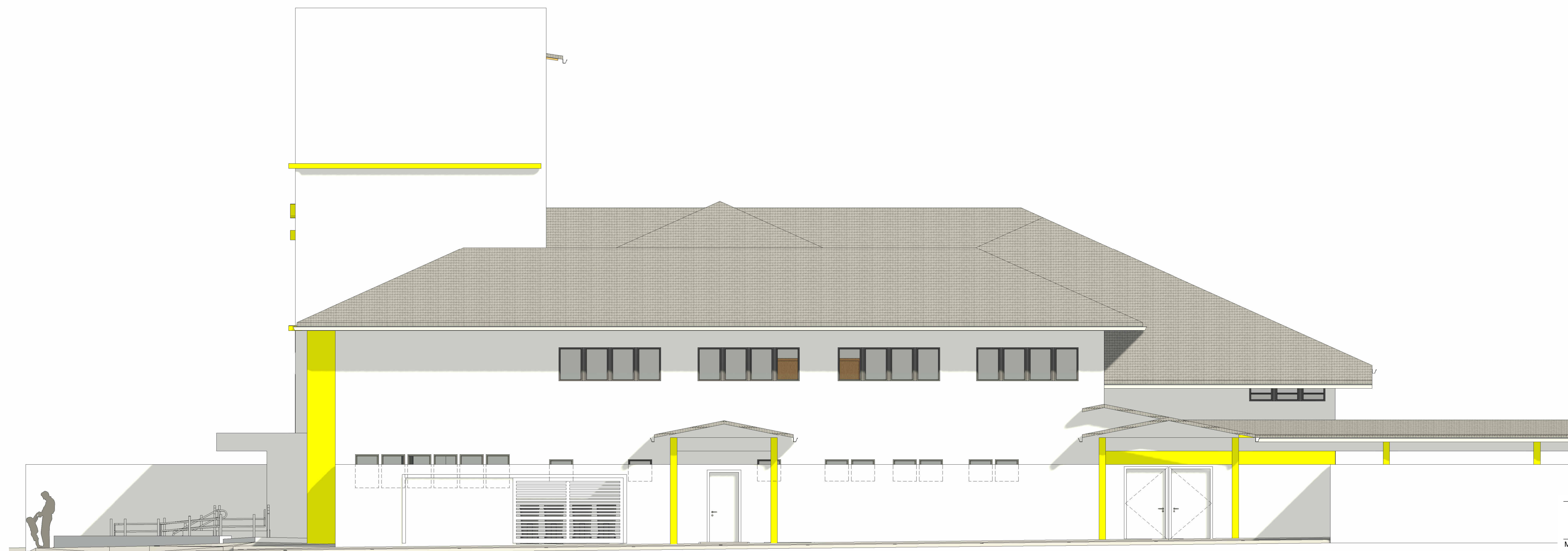
2 FACHADA LATERAL ESQUERDA Escala 1 : 75