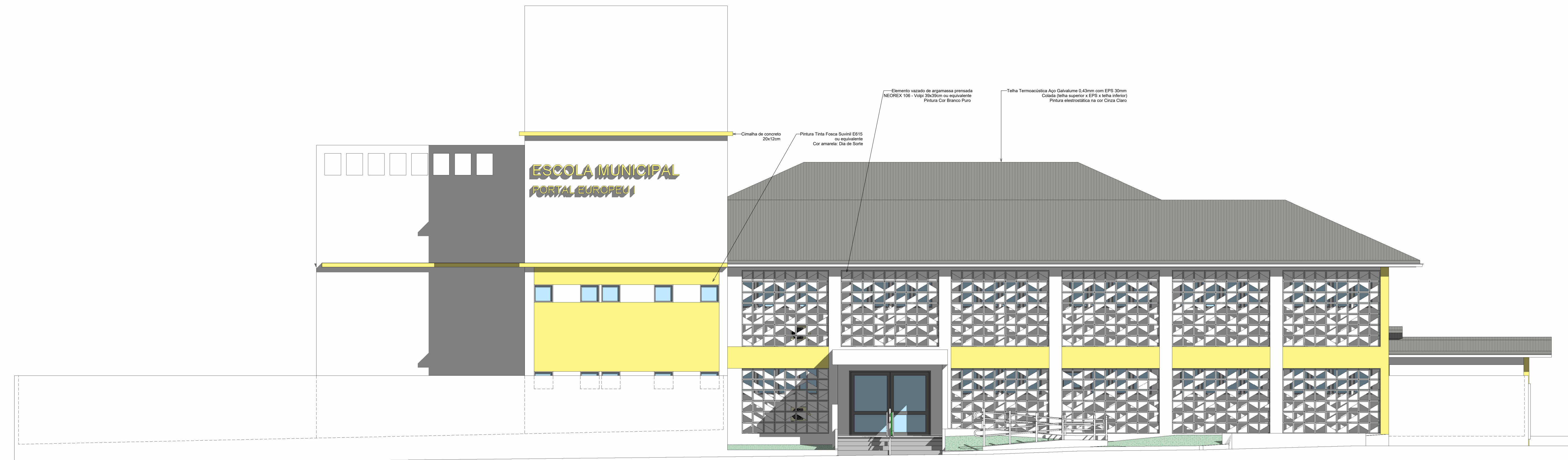
1 FACHADA FRONTAL Escala 1 : 75