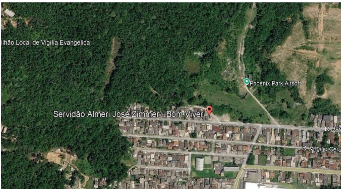
Figura 2 - Localização da via.