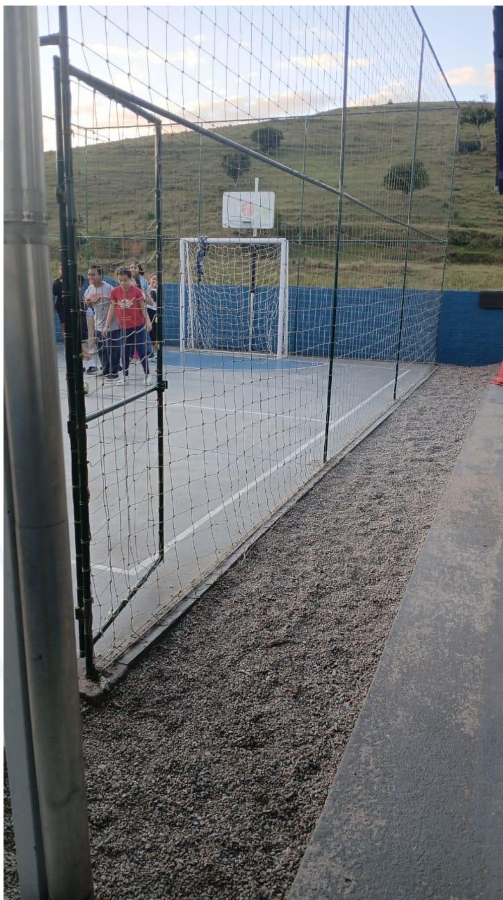
Figura 5 - Vista entre a quadra e a edificação