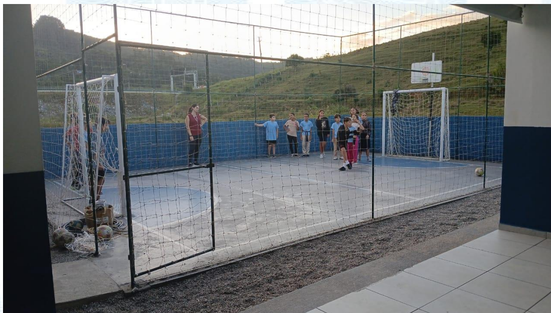
Figura 1 - Vista do refeitório

O presente relatório fotográfico tem por finalidade identificar o local destinado à implantação da cobertura metálica, bem como apresentar as condições existentes e os serviços auxiliares necessários.