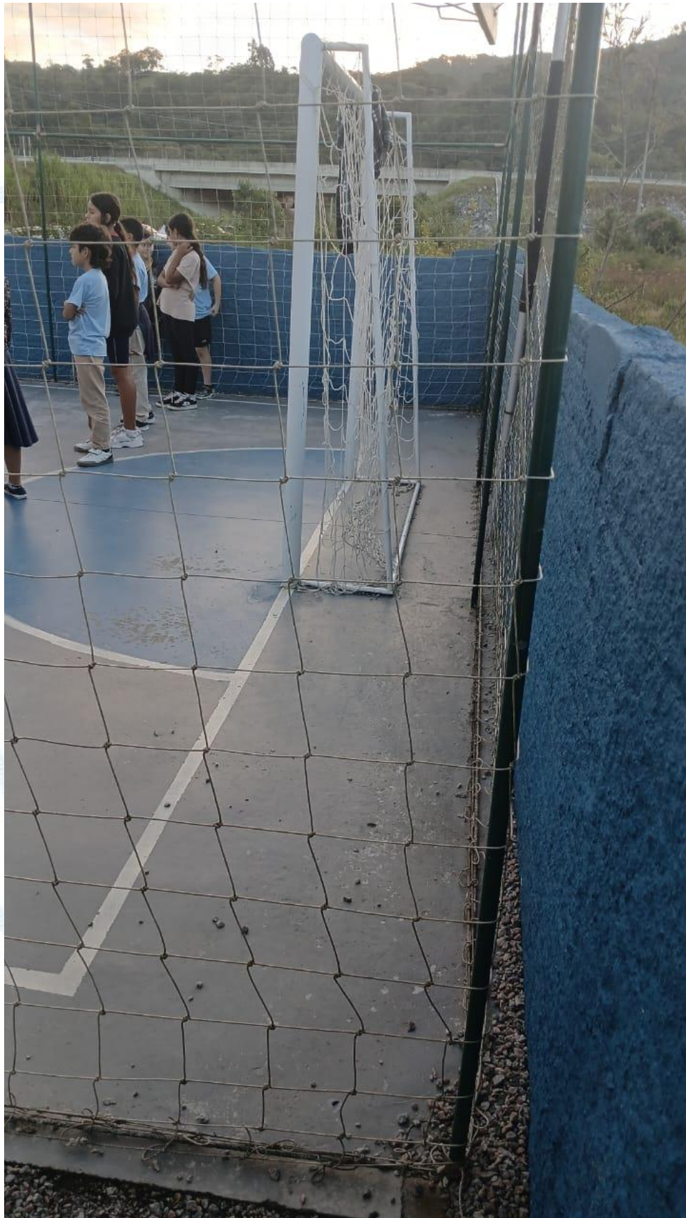
Figura 3 - Vista do muro dos fundos