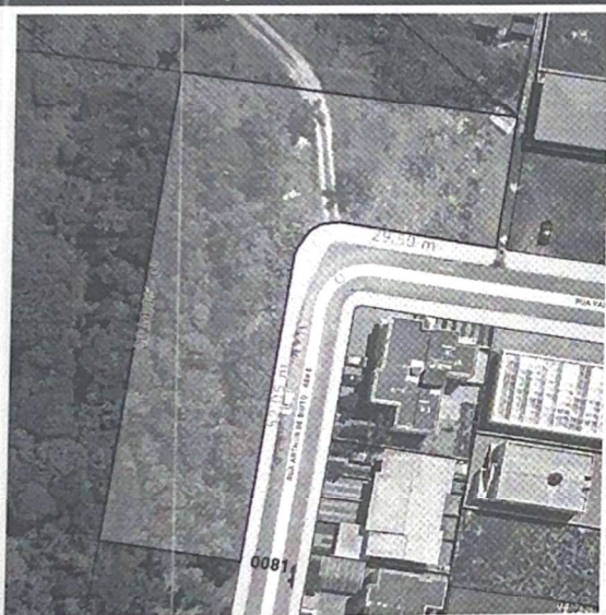
IMAGEM DO IMÓVEL