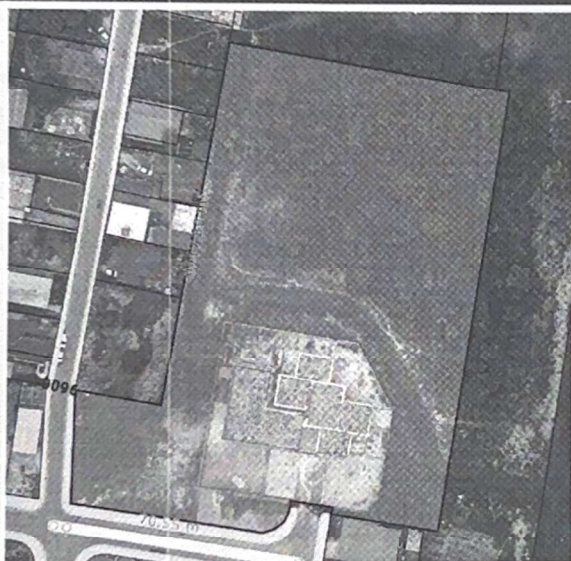
IMAGEM DO IMÓVEL