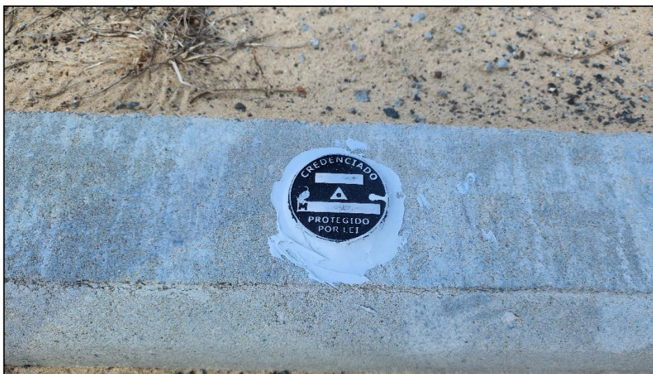
Figura 3: Pino implantado no local de projeto.