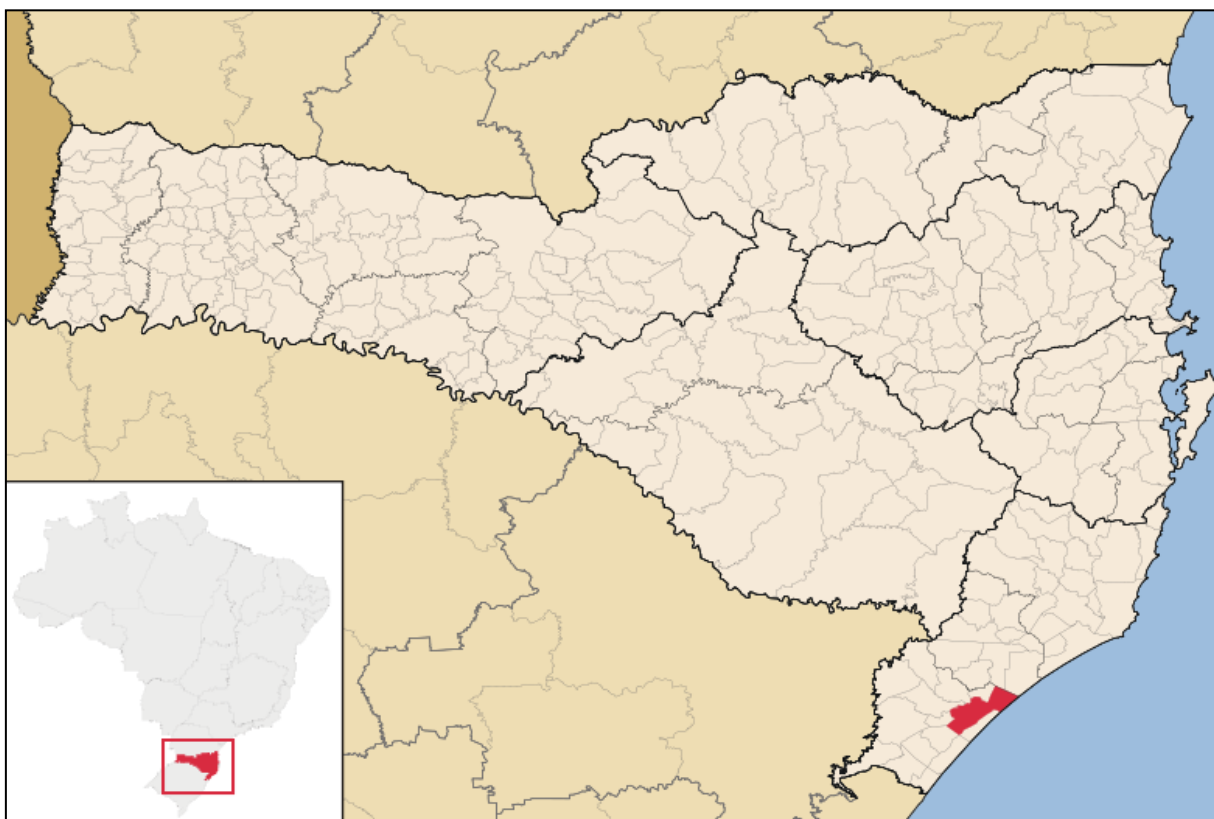
Figura 1: Localização do Município em Santa Catarina.