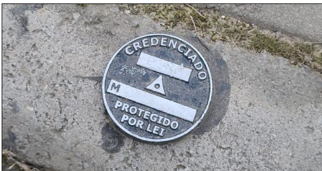
Figura 3: Pino implantado no local de projeto.

A Figura 3 apresenta um modelo de pino implantado no local de projeto.